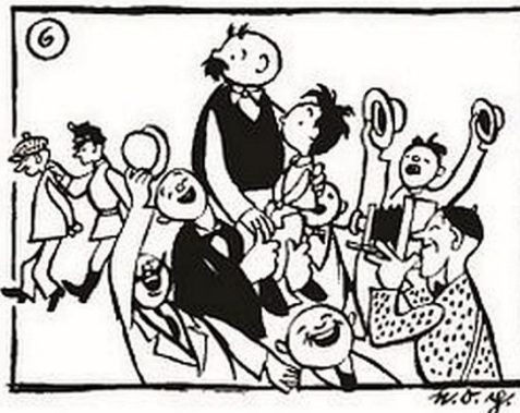
Der Bankräuber, Berliner Illustrirte 17/1936